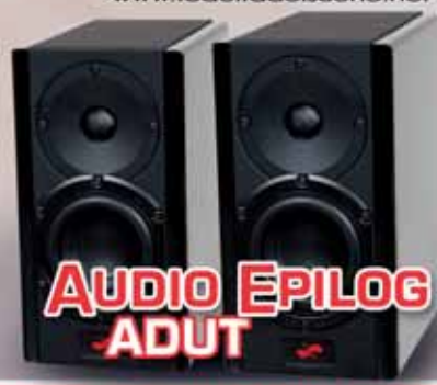
AUDIO EPILOG ADUT

Prêt à sonner: impianto tutto McIntosh (diffusori compresi) - Intervista: Simon Yorke - Music Hall CD 25.2 - Cocaine S40 - Cary Audio CAD 211 Monster Cable SRGS 10/10 - Approfondimento tecnico e ascolto in multi amplificazione: B&W Signature Diamond - Musica: Lang Lang