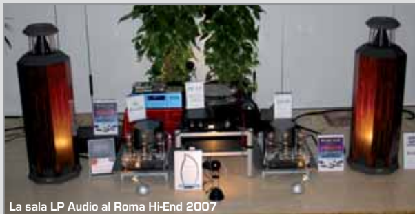
La sala LP Audio al Roma Hi-End 2007

E forse è insita proprio in ciò, la filosofia di questo impianto.